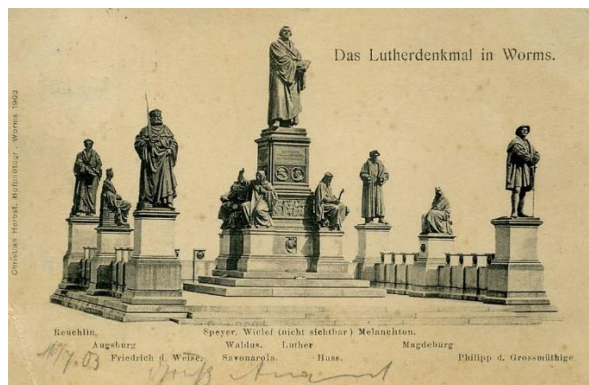
Estructura del monumento de Worms

En esta ciudad de Worms se levantó en 1868 uno de los mayores monumentos a la Reforma iniciada por Lutero. El monumento consta de doce estatuas y ocho medallones de las figuras más importantes de la Reforma. Lutero en el centro, y abajo, alrededor suyo, las estatuas de cuatro personajes considerados como “pioneros” de la Reforma en Europa: Pedro Valdo, John Wycliffe, Jan Huss y Girolamo Savonarola.