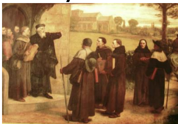
John Wycliffe guiando a sus seguidores

John Wycliffe nació en el interior de Inglaterra, en una granja de ovejas a 200 millas de Londres. Ingresó a la Universidad de Oxford en 1346. En pocos años ya era considerado el principal filósofo y teólogo de la institución. En 1374 se convirtió en rector parroquial de Lutterworth.