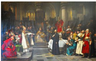
Jan Huss compareciendo en el Concilio de Constanza

Jan Huss nació en el reino de Bohemia alrededor de 1369. Nacido en una familia pobre, entró en el sacerdocio, buscando prestigio y una mejor vida. Llegó a ser un reconocido predicador, pero pasó mucho de su tiempo sirviendo en la academia como decano de la facultad de filosofía de Praga.